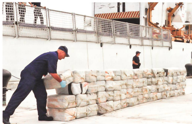
Mitglieder der Besatzung der US-Coast Guard stapeln konfisziertes Kokain in ihrer Basis in Miami. Die 88 konfiszierten Kokainpakete haben einen geschätzten Strassenverkaufswert von ca. 87 Mio. US-Dollar.

für zu Beginn ihrer Entwicklung exklusiv terroristische Gruppen, welche die Vorzüge von Drogenproduktion (Heroin und Kokain) und Drogenhandel entdeckt haben. Akteure der libanesischen Hizbullah operieren auch auf dem amerikanischen Kontinent, um einerseits legale und illegale finanzielle Investitionen zu tätigen und andererseits terroristische Aktionen