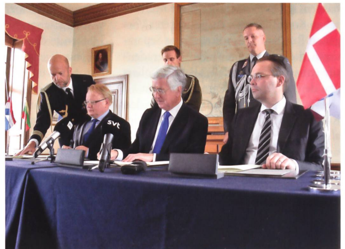
Gemeinsam am Tisch: Schweden, das Vereinigten Königreich und Finnland (v.l.).