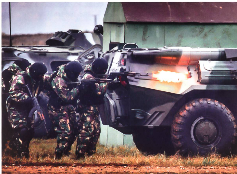
Einsatzübung der Nationalgarde.

regelt. Gleichzeitig sieht die neue Rechtslage im Falle einer Krise im Inland eine direkte Unterstellung der russischen Streitkräfte unter die Nationalgarde vor. Entsprechend kann davon ausgegangen werden, dass Russland derzeit eher mit einer Krise im Inneren als einer grösseren Bedrohung von Aussen rechnet. Bereits werden durch die Nationalgarde besondere IT-Einheiten zwecks Analyse der Social-Media eingesetzt. Dazu äussert sich der russische Premier Dimitry Rogozin eindeutig: «Die Rosgvardiya muss Russlands aggressivste Militäreinheit sein, bewaffnet bis an die Zähne mit der besten und technologisch fortschrittlichsten Ausrüstung. Denn nur so können die Hauptprobleme im Land gelöst werden.»