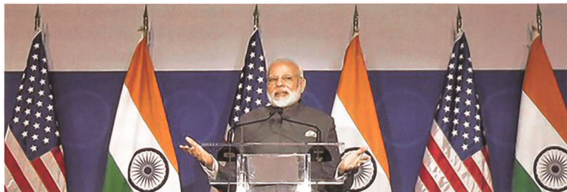
Indiens Premierminister Modi.

Indien will in den USA 22 unbewaffnete Drohnen kaufen. Das US-Aussenministerium hat den umstrittenen Kauf gebilligt, der Kongress muss