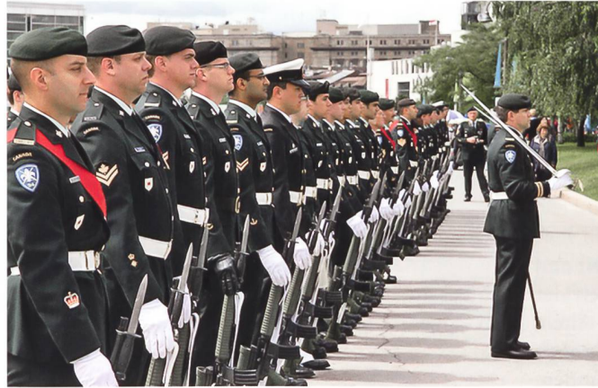
Canada Day Military Parade.

Auch Vertreter der Ureinwohner sind eher unzufrie-