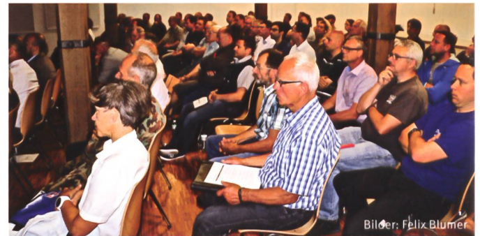
Die Referate fanden grossen Anklang bei den Orts-Quartiermeistern.

An der Veranstaltung der Koordinationsstelle 4, die für die Zuweisung der Truppen in der Ostschweiz verantwortlich ist, nahmen 75 Ortsquartiermeister oder deren Stellvertreter teil. Zu Beginn der