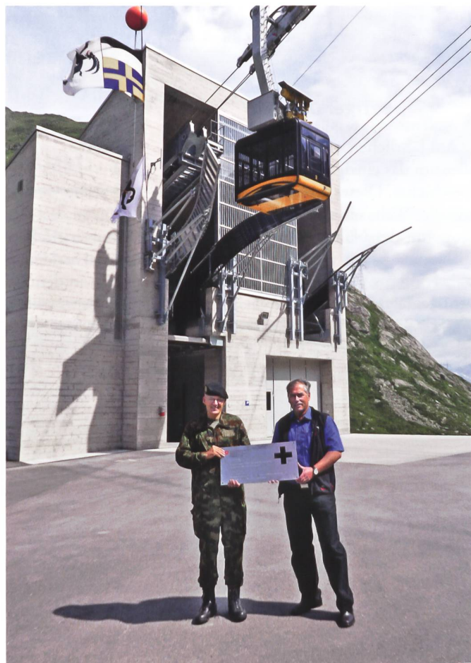
C FUB, Div Theler und der Chef der Betreiber Mannschaft vor der Talstation.

Während vier Jahren Bauzeit unter teilweise extremen und gefährlichen Bedingungen an der Wetterscheide und auf grosser Höhe ist eine neue, mit zeitgemässer Technik ausgestattete Anlage entstanden.