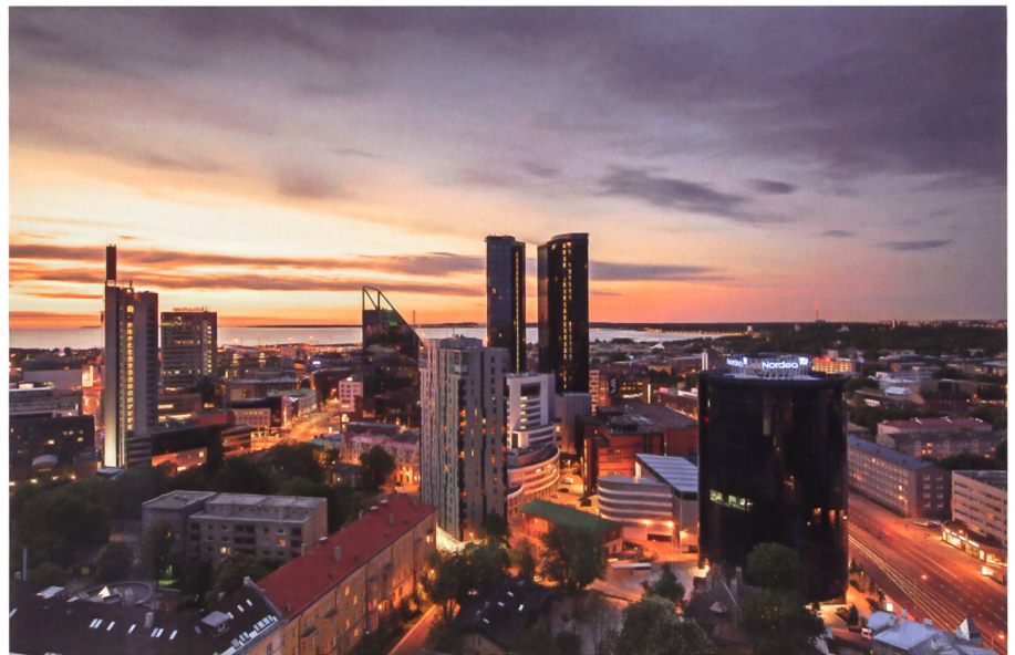
Die neue Skyline von Tallinn. Dominierend sind die Zwillingstürme des Swissôtel Tallinn.

Längst aber hat sich das Bild Estlands sowohl in psychologischer als in militärischer Hinsicht völlig verändert. Es war wohl der Trotz seiner Menschen gegen die drohende,