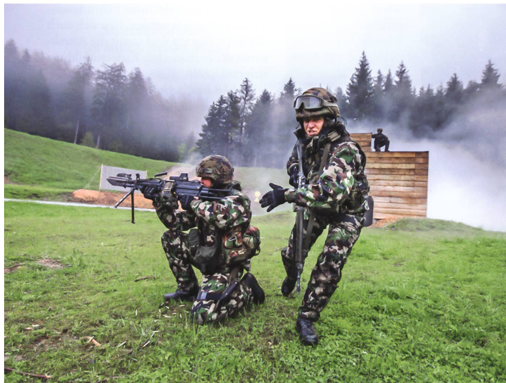
Resiliente AdA begegnen Belastungen mit Zuversicht.

Nach dem Training wurden die Teilnehmer gefragt, inwieweit sich die Inhalte in den Alltag transferieren lassen. 81% der Teilnehmer berichten, dass sie die gelernten Inhalte im zivilen Alltag einsetzen können. Aber auch im militärischen Setting scheinen die Inhalte gut anwendbar zu sein, berichteten doch 88% der Aspiranten, dass sie das Gelernte bei der Ausübung ihrer militärischen Funktion