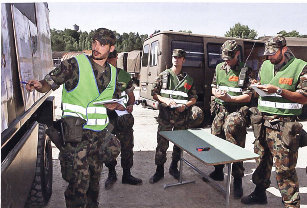
Das Resilienztraining hilft, die Führungsqualität zu optimieren.

Das ART ist in vier Lektionen à 90 Minuten aufgebaut (Übersicht siehe Tabelle) und stellt eine integrative Vernetzung von bewährten Konzepten aus der Kognitiven Verhaltenstherapie und Positiven Psychologie dar. Die einzelnen Module bedienen die sechs Kernkompetenzen der Resilienz. Kurze Theoriesequenzen leiten jeweils eine neue Thematik ein, danach werden die Inhalte im Rahmen von Übungen vertieft. Damit die Teilnehmer maximal vom Training profitieren können, verfolgen wir einen individuums-orientierten Ansatz, das heisst, alle Übungen werden an eigenen und nicht an vorgegebenen Situationen durchgeführt. Dadurch können sich die Teilnehmer selbstreflexiv mit eigenen belastenden Situationen auseinandersetzen und der erste Schritt für den