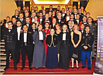
22 Militärischer Erfahrungsaustausch