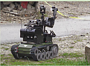
38 Verteidigung im Zeitalter von Cyberwar und Robotern