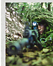
Scharfschütze mit Sturmgewehr 90 mit Zielfernrohr.