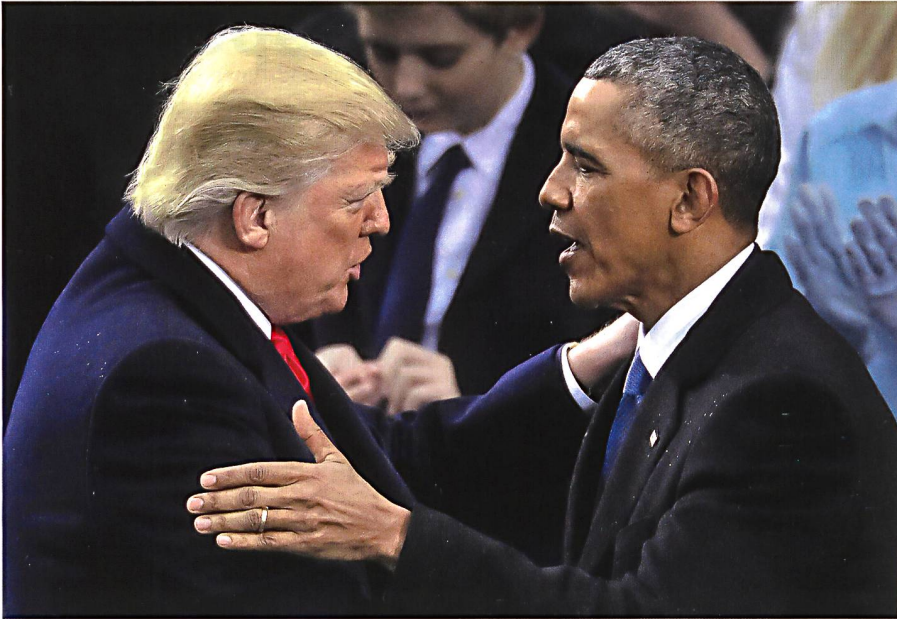
Präsident Obama gratuliert Präsident Trump nach der Vereidigung (Januar 2017).