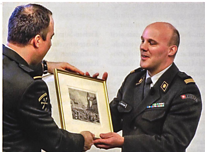
Der scheidende Präsident empfängt aus der Hand des Nachfolgers ein Zeichen der Anerkennung.