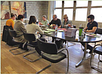
4 Beschaffungen von «unten nach oben»