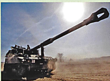
20 Mechanisierte Brigade 4