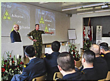
32 Korpsgeist 2018