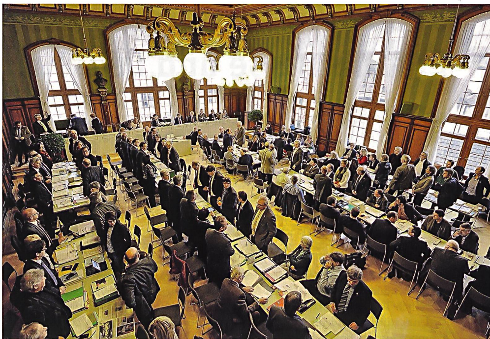
Grosser Rat Kanton Thurgau bei einer Abstimmung.

Per 1.1.2018 gibt es 2222 Gemeinden. Auf dieser kommunalen Ebene sind 15000 Mitglieder von Gemeinderäten meist im Milizamt tätig. Dazu kommen etwa gleich viele Exekutiv- und Legislativräte in Stadt- und Kantonsparlamenten. Zählt man dem kommunalen Milizsystem alle weiteren Behörden und Kommissionsmitglieder hinzu, dann engagieren sich rund 100000 Personen freiwillig für unser Staatswesen auf der kommunalen Ebene.