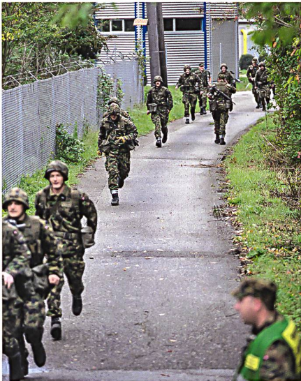
Mobilmachungsübung in der Ter Div 2.

bände und der Koordination von Um- und Neubauten auf Schiess- und Übungsplätzen.