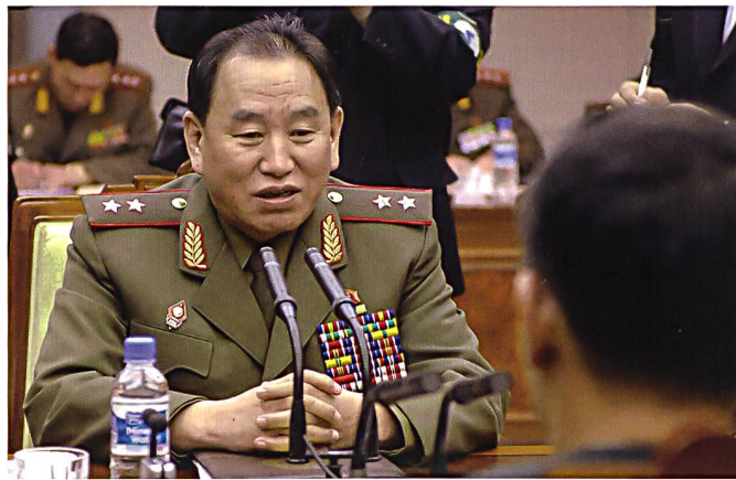
General Kim Yong Chol.

Skeptische Beobachter sind jedoch der Meinung, die Öffnung Nordkoreas sei ein taktisches Manöver, um die junge und unerfahrene Regierung aus dem Süden zu testen und eine Differenz zwischen Seoul und Washington zu schaffen.