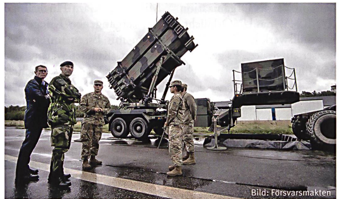
Patriot-Raketen bereits anlässlich Aurora 17 in Schweden.