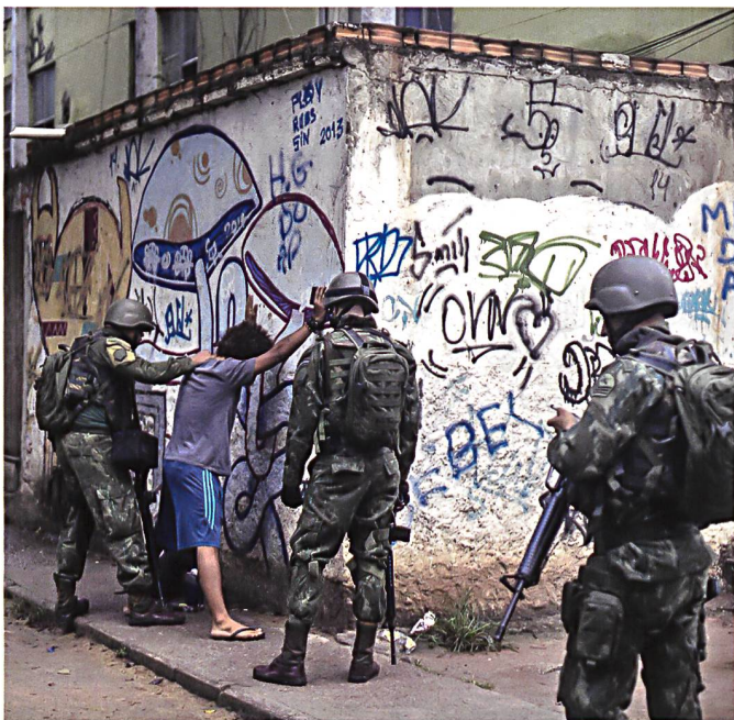
Militäreinsatz in Rio.

Die Opposition kritisierte, dass kaum Details über den geplanten Armeeinsatz bekannt seien und warnte vor Rechtsverstössen. Auch die Menschenrechtsorganisation Amnesty International verurteilte die Massnahme als «extrem und unangemessen». Der Einsatz der Armee gefährde die Menschenrechte.