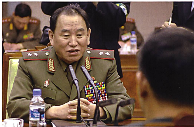
General Kim Yong Chol.

Skeptische Beobachter sind jedoch der Meinung, die Öffnung Nordkoreas sei ein taktisches Manöver, um die junge und unerfahrene Regierung aus dem Süden zu testen und eine Differenz zwischen Seoul und Washington zu schaffen.