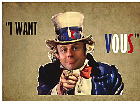
Macrons Ruf zum Dienst.

sich Macron zudem an der Wiedereinführung der allgemeinen Wehrpflicht. Damit löst er eines seiner Wahlver-