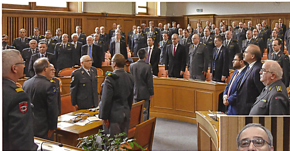
Der Präsident meldet dem CVBS.

Conseiller d'état Alain Ribaux verglich die Platzwahl der SOG-Delegierten witzig mit der Parteiensitzordnung im Ratssaal des Neuenburger Grossen Rates, bevor er die wirtschaftliche Bedeutung des Kantons mit dem Motto «vom Absinth bis zur High-Tech-Uhrenindustrie» beschrieb. Die Armee hätte schon immer eine wichtige Position in Neuenburg eingenommen, sagte der Staatsrat. Das habe mit der Unterstützung und Hilfeleistung an die Bourbaki-Armee 1871 im Val de Travers begonnen und setze sich bis heute fort, am Beispiel der Kaserne in Colombier,