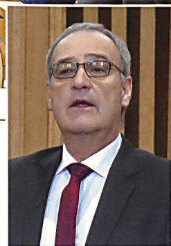
Guy Parmelin, CVBS

Sicherheit kennt keine Ruhepausen, die Geschäfte WEA, die Erneuerung der Luftverteidigung und die Rüstungsindustrie