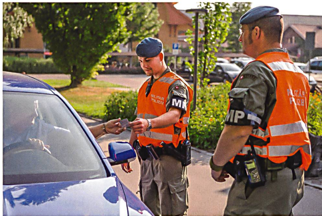
Grundversorgung – Patrouille der MP bei der Personenkontrolle.

Neben den zu erfüllenden militärpolizeilichen Grundleistungen und gegebenenfalls der Sicherstellung des Militärstrafgefängnisses innerhalb der Armee kann das Kommando Militärpolizei im Rahmen der Verteidigung auch Leistungen zur Unterstützung anderer Formationen der Armee oder ziviler Behörden erbringen. Dabei können vornehmlich die Milizformationen des Kommandos Militärpolizei in den Bereichen Schutz von