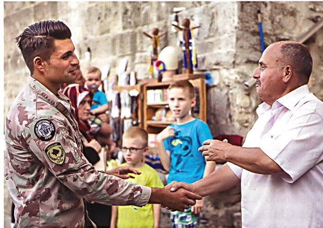
Schweizer Armeeangehöriger eines LMT im Kosovo.

kunft auf andere Missionen legen wird, z. B. in Mali, und somit den Betrieb des Camps nicht mehr sicherstellen kann. Aufgrund dieser Veränderung, gekoppelt mit der Reduktion der SWISSCOY, wurde entschieden, den Standort im Camp Novo Selo, nördlich von Pristina, auf- und auszubauen. Typisch schweizerisch konnte das Projekt pünktlich fertig gestellt wer-