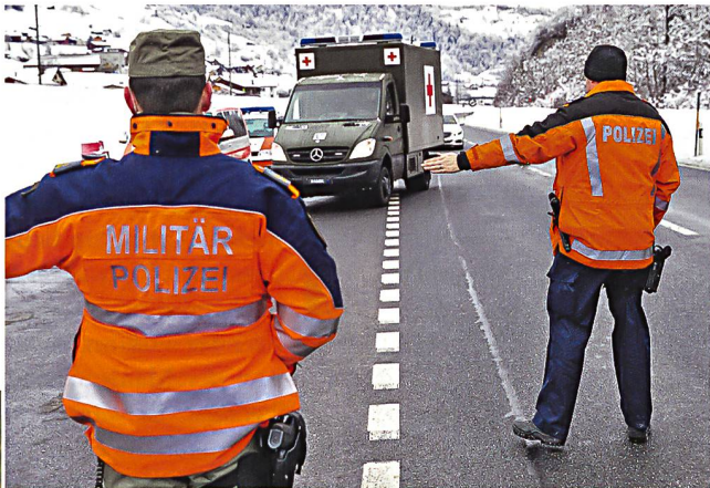
Fahrzeugkontrolle durch Polizei und Militärpolizei.

Der Sicherheitspolitische Bericht 2016 bringt die beschriebene Thematik mit dem Konzept des «erweiterten Verteidigungsbegriffes» treffend zum Ausdruck. Gleichzeitig hält der Bundesrat allerdings ausdrücklich fest, dass diese umfassendere Auslegung der Verteidigung keine Veränderung der Aufgabenteilung zwischen Bund und Kantonen zur Folge haben darf. Jährliche Grossereignisse wie das World Economic Forum (WEF) in Davos bieten die Möglichkeit, gemeinsame Einsätze durchzuführen und Lehren daraus zu ziehen. Mit der strategischen Führungsübung (SFU 17) und der kommenden Sicherheitsverbandsübung (SVU 19) unternimmt die Schweiz weitere wichtige Schritte, um die Abstimmung zwischen Armee und Polizei zu verbessern. Eine Zusammenarbeit auf der materiellen Ebene besteht bereits heute. Dies zeigt sich zum Beispiel darin, dass die Stadtpolizei Zürich in Kürze ein geschütztes Mannschaftstransportfahrzeug (GMTF) der Armee verwenden können. Das schweizerische Milizsystem hat zudem den Vorteil, dass zahlreiche polizeiliche Einsatzleiter ebenfalls mit den Führungsprozessen der Armee vertraut sind. Im Vergleich zum europäischen Umfeld ist die zivil-militärische Kooperation in der Schweiz fortgeschritten und bietet trotz der klaren Aufgabentrennung die Möglichkeit, ein Krisenereignis wirksam im Verbund zu bewältigen. ■