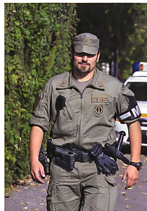
Polizistin und Militärpolizist auf Patrouille.

bei solchen Fällen ein Armeeeinsatz im Inland rechtlich möglich. Der Bundesrat kann einen subsidiären Einsatz von bis zu 2000 Soldaten und einer Dauer von ma-