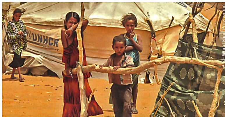
Von der Dürre besonders betroffene Kinder in Mauretanien.

Das jüngste Positionspapier der Welternährungsorganisation (FAO) der Vereinten Nationen zeigt ein düsteres Bild. Es wird erwartet, dass mit Beginn der mageren Jahreszeit, also der Zeit zwischen den Ernten von Mai bis August, in der Sahelzone (Burkina Faso, Tschad, Niger, Mali, Mauretanien und Senegal) mehr als 4,5 Mio. Menschen zusätzlich auf Hilfe angewiesen sein werden. Der Sahel ist von Terrorismus, gewalttätigem Extremismus und deren rasche Ausbreitung in den betroffenen Ländern geplagt. Infolge von schwachen Entwicklungsschritten in der Zone und den Auswirkungen des Klimawandels auf die Nahrungsmittelversorgung, anhaltende Migrationsströme und Konflikte um Land und Ressourcen im 2017 droht die Zahl der Bedürftigen bis Ende Jahr auf fast 24 Mio. anzusteigen. Alleine im Tschad sind 95% der Weidflächen und damit etwa 2,5