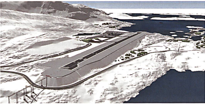
Projekt «Airport Nuuk».