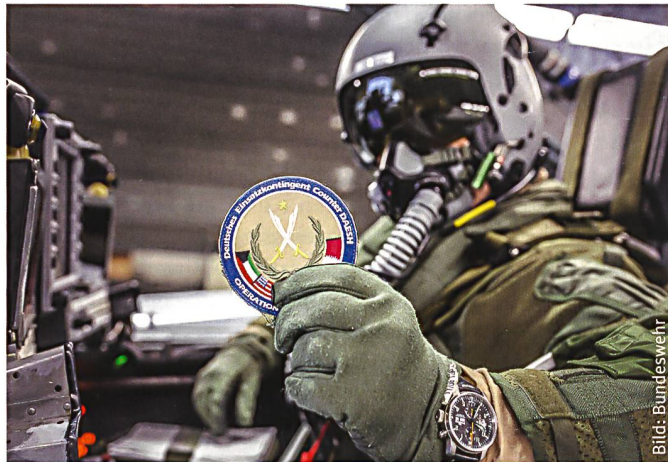
Tornado-Waffensystemoffizier vor dem Einsatz in Syrien.

Bereits zu Beginn des Jahres wurde den Hauptwaffensystemen der Bundeswehr eine dramatisch niedrige Einsatzbereitschaft attestiert. Mit Details konnten jedoch hauptsächlich der schlechte Zustand des Gerätes beim Heer und der Marine belegt werden. Dass die Airbus-Flotte der Luftwaffe beinahe nie in der Luft ist und dreiviertel der Eurofighter meistens grounded sind, war ohnehin schon vorher klar. Nun trifft es aber auch den Tornado-Kampfjet. Als altbewährtes Schlachtross wollte das deutsche Verteidigungsministerium zehn Stück davon zur NATO Response Force melden. Die Auflage, das seit den 70-er Jahren fliegende Vehikel für diesen Einsatz mit moderner Funktechnik und einem Freund-Feinderkennungssystem auszurüsten, kann die Luftwaffe aber nicht erfüllen. Nicht einmal eine Interimslösung wird verwirklicht, denn aktuell sind keine mit dem Jet kom-