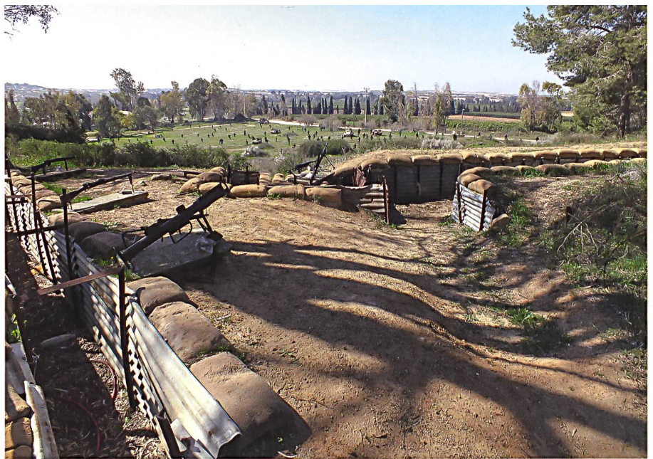
Nachbau der Gefechtsstellungen bei Yad Mordechai, ein israelisches Kibbutz nördlich des Gazastreifens. Hier haben die israelischen Verteidiger im Mai 1948 die ägyptischen Angreifer in einem erbitterten Kampf fünf Tage lang aufhalten können.

Am 15. Oktober brach Israel die Waffenruhe und eröffnete damit die dritte Runde des Krieges. Die israelischen Streitkräfte führten eine erfolgreiche Offensive gegen die ägyptischen Truppen in der Negev. An der nördlichen Front gelang es den israelischen Streitkräften Ende Oktober 1948, Galiläa zu erobern und gar in den Libanon vorzudringen.