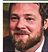
Marcel Serr Magister Artium 10315 Berlin

Israels Unabhängigkeitskrieg war der erste einer Reihe von arabisch-israelischen Staatskriegen und unzähliger militärischer Konfrontationen mit arabischen Terror- und Guerillaorganisationen. Nur mit zwei der einstigen Gegner von 1948 hat Jerusalem bislang Frieden schliessen können (Ägypten und Jordanien). Bis heute muss Israel in einer feindlichen Umwelt bestehen. ■