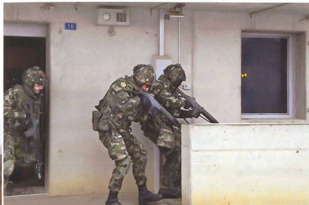
Die «Scorpions» mussten in Nalé rund 30 Häuser säubern.