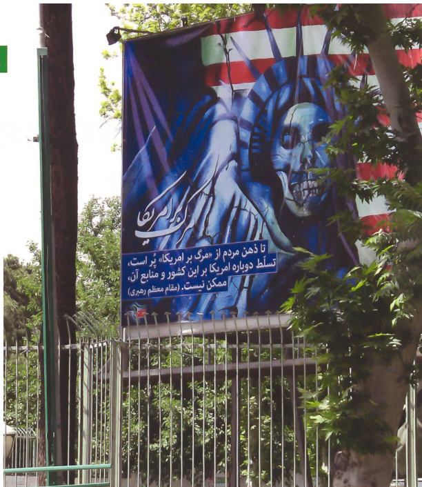
Anti-US-Graffiti ausserhalb der ehemaligen US-Botschaft in Teheran.

Am 12. Juni 2009 gaben bei einer Wahlbeteiligung von 85 Prozent die Iraner dann ihre Stimme ab. Bereits einen Tag später verkündete Teheran – zur Überraschung aller – das offizielle Ergebnis. Der Amtsinhaber erhielt 62,6 Prozent der Stimmen. Die Opposition warf dem Regime Wahlbetrug vor. In den folgenden Tagen trieb es bis zu zwei Millionen Demonstranten auf die Strassen. Auch wenn der Wächter am 22. Juni die Möglichkeit einer Neuwahl mit der Begründung, dass keine