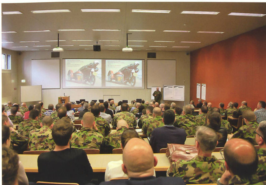
Lehrkörperausbildung HKA 2018: eine Investition in die hohe Qualität der Führungsausbildung, analog zur perfekten Teamarbeit der Rennfahrer.

Umfragen haben gezeigt, dass die Teilnehmenden ein attraktives Programm wünschen, das ihnen Informationen gibt, sie anregt und nicht zuletzt auch Kameradschaft erfahren lässt. Die Zeiten, als grosse Stäbe zur Bearbeitung von ope-