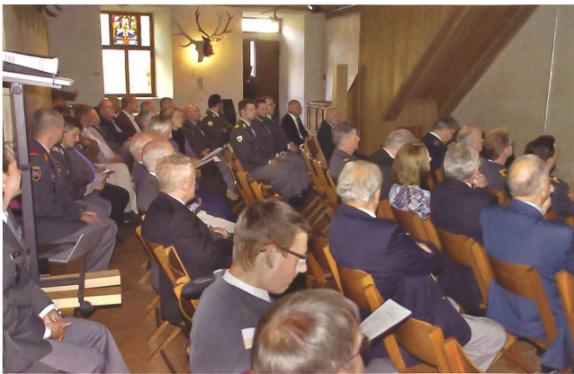
Gut besuchte Generalversammlung auf der Kyburg.