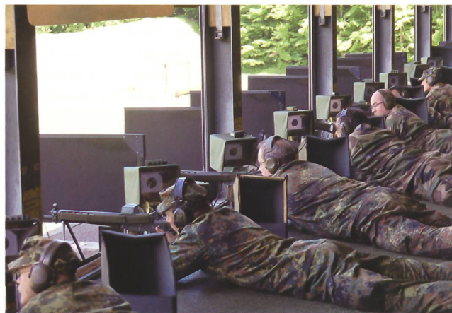
Wettkampf 300 m.