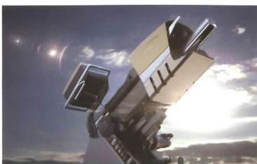
RUAG COBRA Mörsersystem

Das RUAG COBRA 120mm Mörsersystem ist ein Hightech-Produkt, das neue Massstäbe für indirekte Feuersysteme setzt. Ein elektrischer Antrieb und eine halbautomatische Ladevorrichtung sorgen für entscheidende Präzision und Schnelligkeit. RUAG COBRA kann einfach auf jedem Rad- oder Kettenfahrzeug montiert werden und ist so ausgelegt, dass die Nutzer das System schon nach kurzer Schulungsdauer versiert einsetzen können.