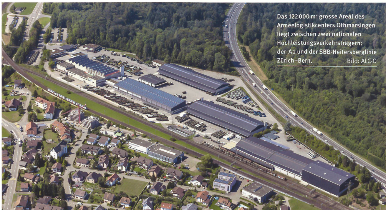
Das 122 000 m 2 grosse Areal des Armeelogistikcenters Othmarsingen liegt zwischen zwei nationalen Hochleistungsverkehrsträgern: der A1 und der SBB-Heitersberglinie Zürich–Bern.

Mit der von der Armeereform XXI angestrebten Straffung, Zentralisierung