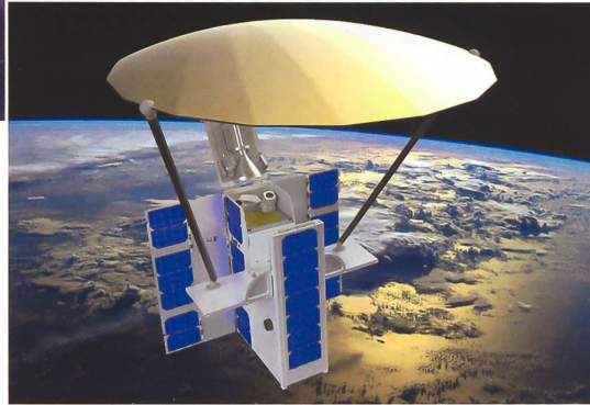
Kleinsatelliten mit einer Übertragungsfähigkeit von mehr als 1 Gbps (Gigabits per second) werden ab 2018 in die Bahn gesetzt.

In Krisen und Konflikten geht es beispielsweise konkret darum, verlässliche Informationen darüber zu haben, über welche Fähigkeiten ein (potenzieller) Gegner zur weltraumgestützten Aufklärung verfügt. Verlässliche Angaben darüber, zu welchem Zeitpunkt welcher Satellit mit welchen Fähigkeiten (z.B. Bild- oder Radaraufklärung) die Schweiz überfliegt, be-