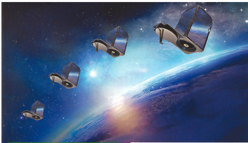
Kleinsatelliten ermöglichen heute eine Multiplikation von Aufklärungsfähigkeiten im Weltraum.

rungsstab der Armee (heute Stab Kommando Operationen) im Führungsgrundgebiet 3/9 eine aus Milizoffizieren alimentierte Zelle «Weltraum» geschaffen. Die Zelle umfasst aktuell 14 Offiziere, welche aufgrund ihrer beruflichen Tätigkeit und/oder fachlichen Qualifikation spezialisiertes Know-how aus akademischer und unternehmerischer Sicht zusammentragen und der Armee in ihrer Milizfunktion verfügbar machen.