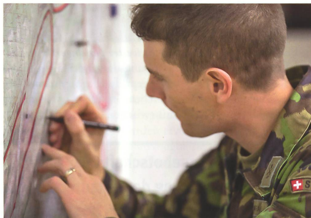
Teilnehmer GLG I/17 bei der Erarbeitung eines Nachrichtendienstlichen Konzeptes (NDK).

der Gegner konventionelle Kräfte einsetzen muss, um sein Ziel zu erreichen? Welche Mittel werden wir noch zur Verfügung haben und auf welcher Infrastruktur können wir noch basieren? Wie ist die Moral der noch verbliebenen Kader und Soldaten? Für mich ist klar, dass wir nicht mit den Soll- bzw. OTF-Beständen (Organi-