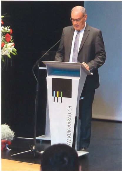
Für VBS-Vorsteher Guy Parmelin umgehen momentan zu viele junge Leute den Militärdienst.