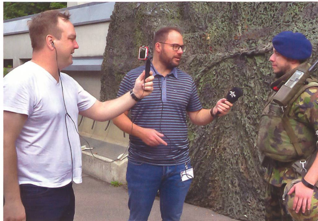
Das Lokalfernsehen versucht, an Informationen zu kommen.

Miliztruppendienst sowie Fachleuten aus der Luftwaffe und dem Air Operation Center (AOC) die Übung CHESS 18-2 konzipiert, geplant und erfolgreich durchgeführt. Getreu dem Ziel, der Truppe auch «Action» zu bieten, wurden nicht nur Flug-