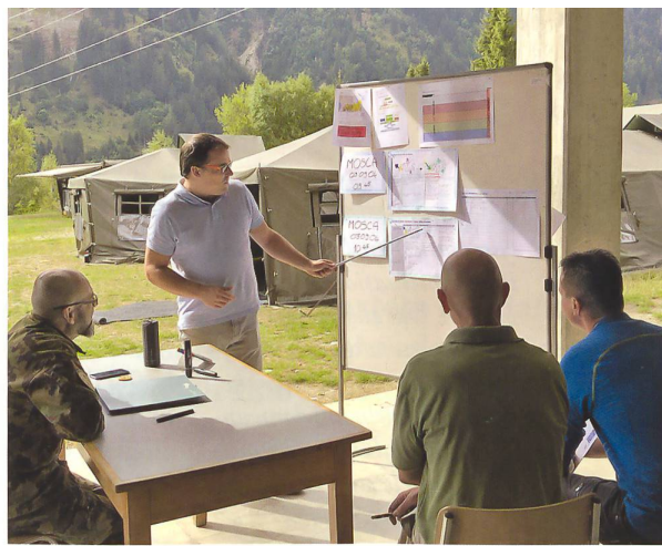
Stabsarbeit heisst auch: Präsentieren von Resultaten.

Der Kurs folgt einem etablierten Modell: Durch praktische Übungen lernen und militärische Entscheidungsprozesse anwenden. Am ersten Tag wird mit Hilfe eines Krisenszenarios, das durch die Schliessung einer wichtigen Verkehrsachse unseres Landes verursacht wird, das Wissen über die ersten drei Phasen der 5+2 Methode (Problemerkennung, Beurteilung der Lage, Entschlussfassung) ver-