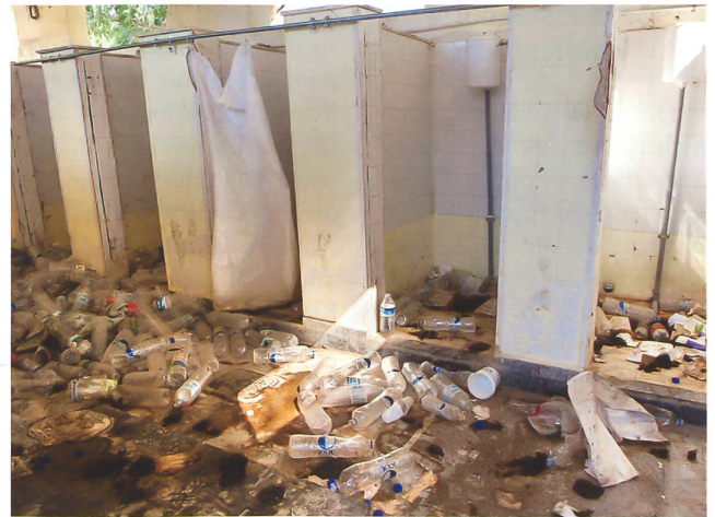
Toiletten im Moria-Camp.