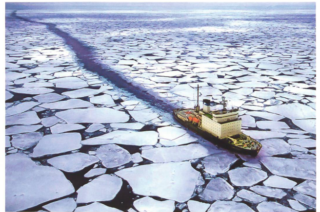
Arktis wird schiffbar.