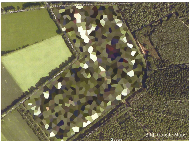
Munitions- und Tankanlagen in Staphorst, Niederlande.

Holland gibt es derweil unzählige auf Google Maps nicht erkennbare Bereiche. Für die Unkenntlichmachung von Munitionsdepots, Einrichtungen des Königshauses und sicherheitsrelevanten Bauten auf Luftbildern ist dort ein nationales Gesetz verantwortlich. Für diverse weitere Länder stellt Googles Verhalten deshalb ein «no-go» dar. Darum werden beispielsweise in China, der Krim, auf Kuba, im Iran und Nordkorea, dem Sudan, Syrien und Vietnam die entsprechenden Dienste gänzlich zensiert und sind nicht funktionsfähig. Diesen Schritt will Belgien natürlich nicht gehen, eine Einschränkung des Marktzugangs für Google wäre unverhältnismässig. Dennoch pocht das Land auf seine Sicherheitsbedenken. «Das Verteidigungsministerium wird Google verklagen», sagte deren Sprecher sachlich anfangs Oktober. Google wurde in diesem Jahr von der Europäischen Union zu einer Rekordstrafe von fünf Mia. Euro verurteilt, dies weil vorinstallierte Android-Software auf mobiler Hardware die Auswahl der Kunden einschränkte. Ebenfalls gab es einige Rücktritte von Google-Verantwortlichen, weil der Konzern beabsichtigt, in China eine Suchmaschine in zensierter Form auf den Markt zu bringen.