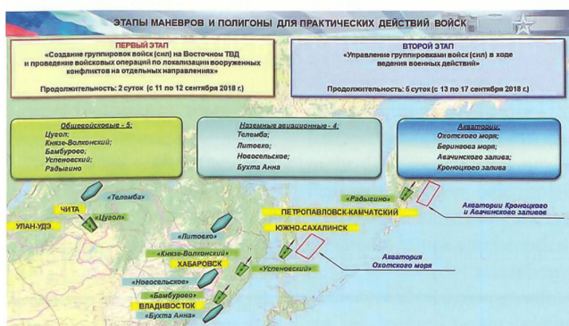
Übungsanlage «VOSTOK 2018».

te. Das Signal wurde in den USA aber verstanden, Moskau ist militärisch nicht isoliert und hat grosse und starke Verbündete. Entscheidend ist aber, dass der Westen derzeit nicht in der Lage ist, ein Manöver in gleicher Grösse durchzuführen. Entsprechend kann Russland hier einen klaren Propagandasieg verbuchen. Vladimir Putin meinte denn auch bei einem Truppenbesuch am Rande der Abschlussparade lapidar: «Russland ist eine friedliebende Nation, die bereit ist, ihre nationalen Interessen und Verbündeten zu verteidigen.»