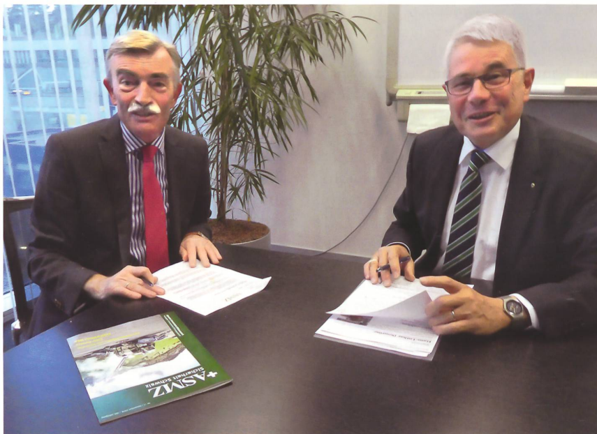
General Domröse und der Chefredaktor im angeregten Gespräch.

Wir haben das Niederschlagen des Arabischen Frühlings in Syrien erlebt. Das hat zu diesem achtjährigen Krieg geführt mit unendlich vielen Flüchtlingen, von denen sich allein in der Türkei fast vier Mio. aufhalten. Mittendrin in diesem Unruheherd liegt Israel. Der lachende Dritte ist nicht der Iran, sondern Israel. Dies, weil wir im Rahmen der ganzen Verzahnung der Konflikte zwischen Saudi-Arabien und dem Iran, dem Syrien Krieg und dem Konflikt zwischen den Kurden und der Türkei den Blick auf Israel ein wenig verloren haben. Wer weiss, ob es im Nachgang zu einer