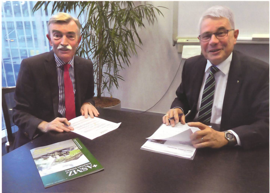
General Domröse und der Chefredaktor im angeregten Gespräch.

Wir haben das Niederschlagen des Arabischen Frühlings in Syrien erlebt. Das hat zu diesem achtjährigen Krieg geführt mit unendlich vielen Flüchtlingen, von denen sich allein in der Türkei fast vier Mio. aufhalten. Mittendrin in diesem Unruheherd liegt Israel. Der lachende Dritte ist nicht der Iran, sondern Israel. Dies, weil wir im Rahmen der ganzen Verzahnung der Konflikte zwischen Saudi-Arabien und dem Iran, dem Syrien Krieg und dem Konflikt zwischen den Kurden und der Türkei den Blick auf Israel ein wenig verloren haben. Wer weiss, ob es im Nachgang zu einer