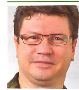
Korpskommandant Aldo C. Schellenberg Chef Kommando Operationen / Stellvertreter Chef der Armee 3003 Bern

Die im Rahmen der WEA neu konzipierte Mobilmachung hat zum Ziel, die zivilen Behörden bei nicht vorhersehbaren Ereignissen innerhalb von zehn Tagen mit bis zu 35 000 AdA zu unterstützen, respektive bei Bedarf die gesamte Armee aufbieten zu können. Damit dies möglich ist, müssen die Mobilmachungsprozesse regelmässig trainiert werden. Dabei dienen die Mobilmachungsübungen dazu, die relevanten Prozesse bei der Truppe als Standardverhalten zu implementieren. ■