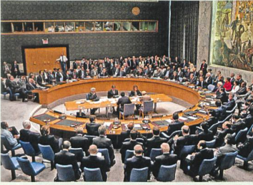
6 Sicherheitsrat der UNO