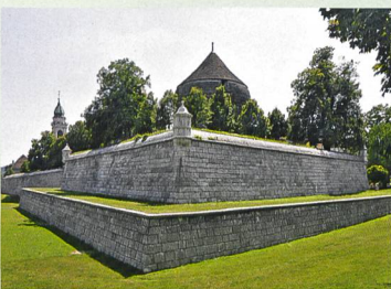
34 Schanzen in Solothurn