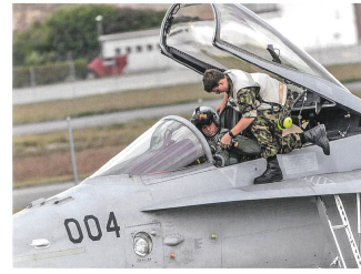
Fliegersoldat unterstützt den Piloten bei den Flugvorbereitungen.

Die Schweizer Luftverteidigung steht vor einem Meilenstein, das ist für mich klar. Der Entscheid Air2030, beziehungsweise die Beschaffung neuer Systeme – Fliegerabwehr, neues Kampfflugzeug, und auch die Sensorik – ist entscheidend, ob wir in Zukunft den Auftrag erfüllen können oder nicht.