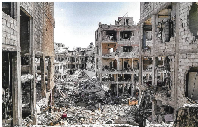
Yarmouk nach der Rückeroberung.

Die syrische Regierung befürwortet die Rückkehr der Palästinenser in ihre Camps. Problematischer ist die Situation aber in Yarmouk. Dort lebten vor dem Konflikt rund 160000 Flüchtlinge. Die überwiegende Mehrheit der Häuser und Grundinfrastruktur ist aber zerstört. Aus dem neben Damaskus gelegenen Ort konnten erst im Mai 2018 die letzten Kämpfer des Islami-