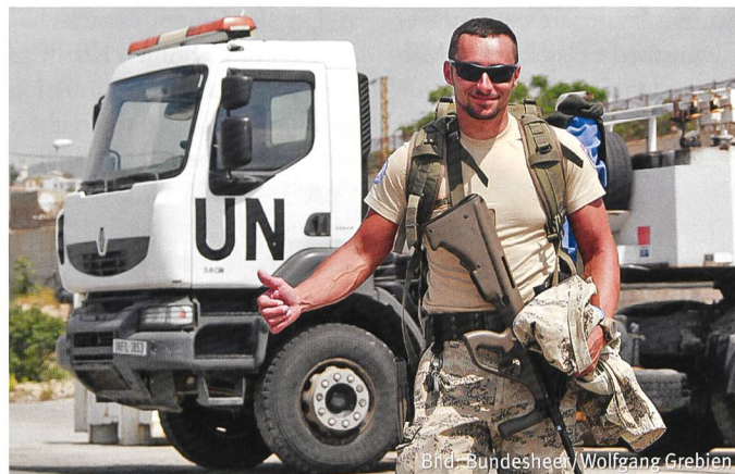
Bleibt: ÖBH-Soldat der Multi Role Logistic Unit im Libanon.

Konkret können laut Beschluss weiterhin bis zu 600 Soldaten in den Kosovo (Bestand aktuell 430), 400 nach Bosnien Herzegowina (Be-