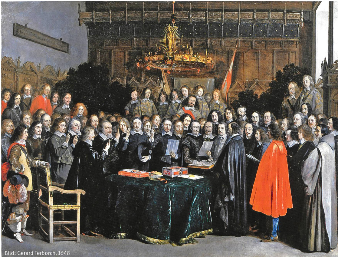
Bild: Gerard Terborch, 1648