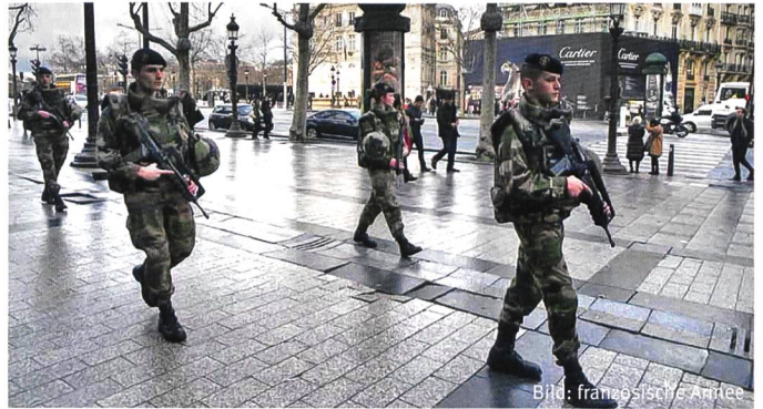
Patrouille der französischen Armee nach den Attentaten in Paris.

Mental und physisch sind diese Einheiten nicht in der Lage, auch nur annähernd in der geforderten Zeit «Wirkung im Ziel» zu erbringen. Um in einer kriegerischen Auseinandersetzung auch nur einigermaßen bestehen zu können, werden zwischen sechs und zwölf Wochen an intensiver gefechtstechnischer Ausbildung benötigt. Auch dann verbleibt, dass im mentalen Bereich keine noch so gute fachtechnische Ausbildung den fehlenden Praxisbezug der Schweizer Armee wettmachen wird. Wer sein Armeeleben lang in simulierten Übungen von durchschnittlich 15 Minuten auf Panzerattrappen geschossen hat, wird den kriegerischen Alltag weder annehmen noch überleben können. Zudem wird die Bereitschaft, den Auftrag unter Einsatz des Lebens zu erfüllen, nur bei wenigen Prozenten der Truppe überhaupt vorhanden sein. Der weitaus grösste Teil wird das eigene Überleben in den Vordergrund stellen. Es besteht die Gefahr, dass sich die Armee im Wesentlichen mit sich selber beschäftigt.