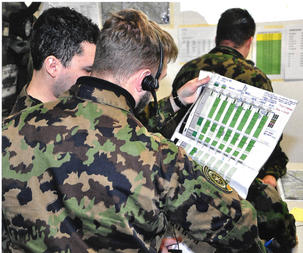
Führungssimulation: Mittel Tabellen müssen immer wieder konsultiert werden.

«... Wert der Persönlichkeit ist in Krisensituationen entscheidend, und zwar in ausgeprägterem Mass, als wir in der Führungsausbildung intellektuellweise zu erfassen glauben. Mit «Wert der Persönlichkeit» meine ich das Vertrauen, welches die Unterstellten aller Stufen dem Vorgesetzten entgegen bringen ... Glaubwürdigkeit oder menschliche Autorität zu erreichen, bevor die Truppe unter psychischen Druck gerät, denn sowohl ihre Aufnahmefähigkeit als auch ihre Objektivität reduzieren sich in dieser Situation erheblich ... Erstaunlicherweise wurde spürbar, dass sich die Truppe ... auch gewalttätig gegen eigene Vorgesetzte wenden könnte ... menschliche Nähe zwischen dem Vorgesetzten und den Direktunterstellten als engsten Mitarbeitern ist eine weitere Notwendigkeit, um Krisensituationen zu bestehen. ... die Fehlleistungen der betroffenen Führer stark zunehmen. ... Fehlleistungen werden dort vermindert, wo jemand bereit ist, in die entstehenden Lücken zu springen und nicht einfach seine neuen Freiheiten, die Schwäche des Vorgesetzten ausnutzend, zu missbrauchen. Gerade in dieser Situation, wo der Vorgesetzte zwar noch da ist, aber reduziert arbeitet, tritt aus verschiedenen Gründen nicht unbedingt der ordentliche Stellvertreter in die Lücke, sondern viel eher die Direktunterstellten als Gesamtes ... Daraus folgt, dass