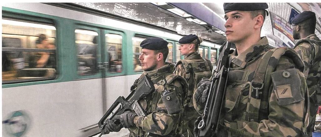
Allgegenwärtig – französische Armee im eigenen Land.

Wenn auch nur vorübergehend, so sind die Franzosen nicht abgeneigt, einen Militär als Chef ihrer Grand Nation zu sehen. Eine Ende März in Frankreich vom Institut Odoxa durchgeführte repräsentative Umfrage zeigt, dass sich 50% der Bürger im Falle erneuter Terroranschläge und einem damit verbundenen Ausnahmezustand dafür aussprechen, das Land von einem Soldaten führen zu lassen. Gar 55% sind bereit, neue Spezialmassnahmen zu befürworten, wenn diese dazu dienen, «die Sicherheit der Einwohner besser zu gewährleisten, auch wenn dies eine Einschränkung der persönlichen Freiheiten bedeuten würde», so die Umfrageergebnisse. Bemerkenswert, sechs von zehn Franzosen glauben, dass sich Frankreich aktuell im Krieg gegen den Terrorismus befindet. Im Vertrauen, dass die Behörden diesen Kampf gewinnen, finden 54%, dass die Armee das