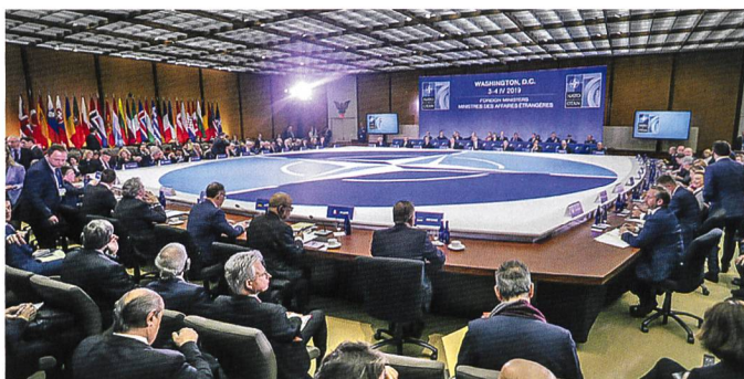
Treffen der NATO-Aussenminister in Washington.

Noch harschere Töne als Deutschland musste sich die Türkei anhören, die sich entschieden hat, ein Raketenabwehrsystem von Russland zu kaufen. «Die Türkei muss wählen: Will sie ein entscheidender Partner des erfolgreichsten Militärbündnisses der Weltgeschichte bleiben, oder will sie die Sicherheit dieser Partnerschaft riskieren, indem sie unverantwortliche Entscheidungen trifft, die dieses Bündnis untergraben?», sagte Pence.