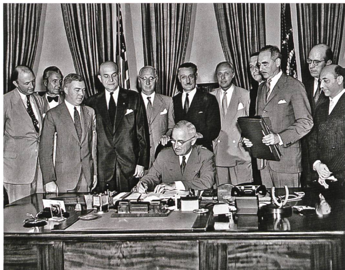
Vor 70 Jahren, Harry S. Truman unterzeichnet das Bündnisabkommen.

litätsprojekte sind grosse Erfolge. Stoltenberg warnt zugleich, dass dieses Momentum aufrechterhalten werden muss. Denn seit siebzig Jahren macht die militärische Allianz zwischen Europa und Nordamerika die NATO zum stärksten Bündnis der Geschichte.