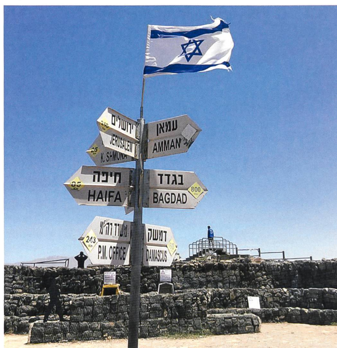
Wie weiter im Golan?

Mit der Anerkennung der Golanhöhen als israelisches Territorium goss US-Präsident Trump Öl ins Feuer des seit dem Sechstage-Krieg lodernen Konflikt zwischen Syrien und Israel. Beide Länder unterzeichneten 1974, nach Ende des Yom Kippur-Krieges einen Waffenstillstand. Die nach offizieller völkerrechtlicher Deutung zu syrischem Staatsgebiet gehörende Bergkette blieb aber seither grossmehrheitlich von Israel besetzt, seit 1981 sogar annektiert. Für die Stabilität sorgt eine UNO-Blauhelmission, die United Nations Disengagement Observer Force (UNDOF) , ebenfalls überwa-