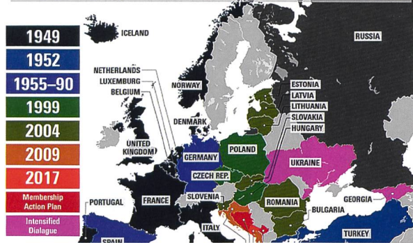
NATO-Osterweiterung bis 2018.

Auslöser bezeichnen müssen, und nicht Russland, welches sich seit dem Ende des Kalten Krieges in der Defensive befindet.