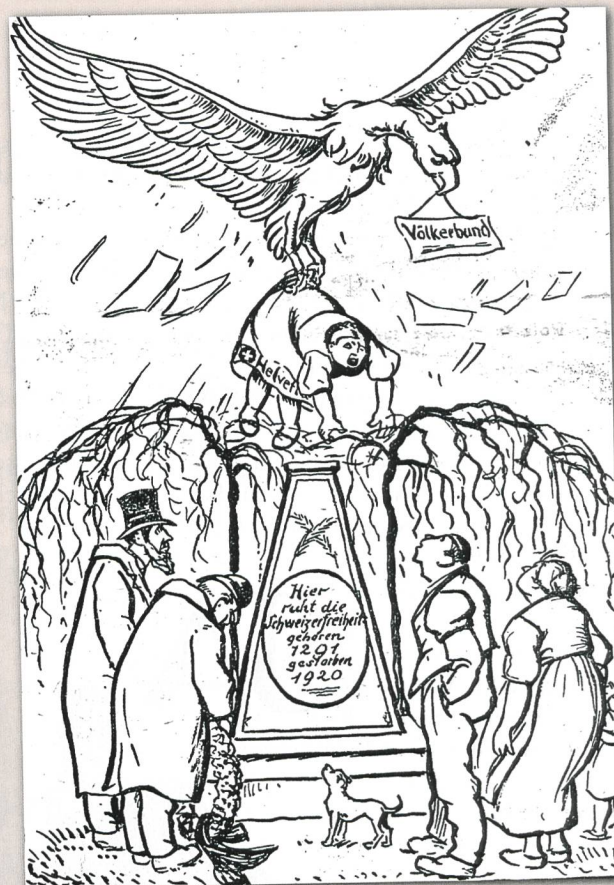
Flugblatt: Archiv Fuhrer

Nur ein verfaultes Volk erhält keine Chance. «Ein Volk, das auf solcher Höhe an Gewerbe fleiss steht wie die Schweiz und durch seinen Handel so mit den Interessen der ganzen Welt verknüpft ist, kann auf die Dauer wirtschaftlich nicht isoliert werden.» Selbstverständlich sind Stockungen möglich. Die USA wird im Völkerbund nicht mitmachen und mit