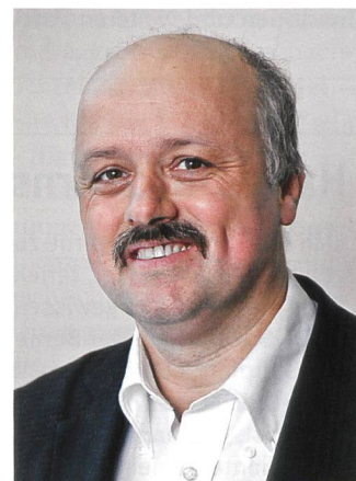
Dieter Kläy, neuer Präsident des Zürcher Kantonsrats.

Wir wissen, dass Dieter das nötige Wissen und die notwendige, breit abgestützte Erfahrung aus vielen politischen Ämtern (Präsident des Grossen Gemeinderates Winterthur, Vizepräsident der FDP Kanton Zürich und viele mehr) mitbringt. In einer Zeit der grossen und drängenden Herausforderungen wünschen wir