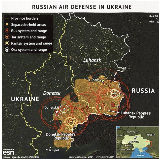
Russische Luftabwehr in der Ukraine.

Die Separatisten in der Ostukraine setzen auch vermehrt zivile Drohnen (Quad-, Hexa- und Oktopter) ein, um Munition, in der Regel Handgranaten mit Splitter und/oder Brandwirkung, abzuwerfen. Der Einsatz von Thermitgranaten auf Treibstofftanks und Munitionsumschlagplätze war dabei besonders verheerend für die ukrainischen Streitkräfte.