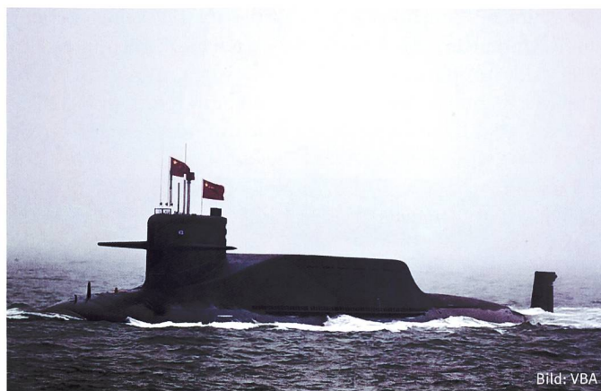
Chinesische U-Boote können mit Julang-3-Raketen ausgerüstet werden.

Am 2. Juni waren merkwürdige Spuren am Himmel über China und anderen Teilen Asiens zu sehen. Eine runde und leuchtende Wolke baute sich hoch am Himmel auf. Wie Militärexperten später erklärten, stammten die Himmelsspuren sehr wahrscheinlich von einer Rakete.