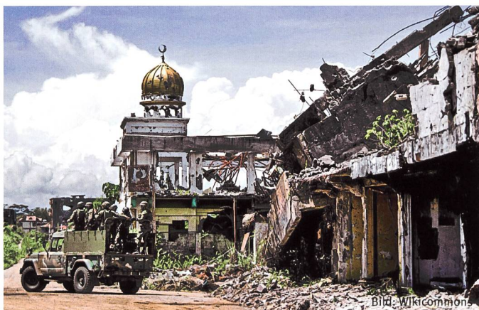
Die zerstörte Stadt Marawi.