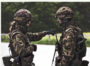
32 Zugführerin erteilt einen Auftrag