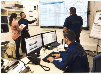
26 Lage- und Nachrichten-zentrum