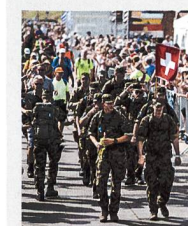
Begeistertes Publikum beim Durchmarsch in Cuijk