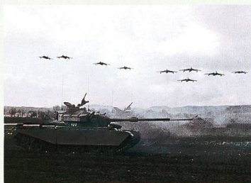
36 Symbole der Wehrhaftigkeit