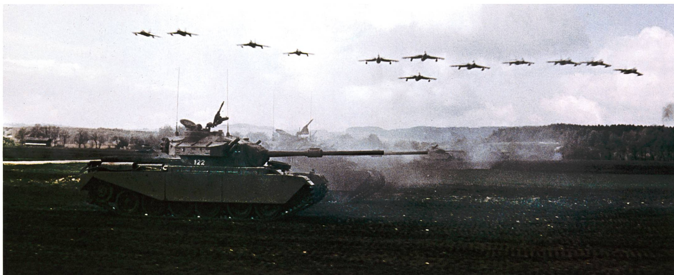
Symbole der Wehrhaftigkeit. Szene aus dem Film «Wehrhafte Schweiz», gezeigt an der Expo 1964.

richt 73», in dem erstmals von Sicherheitspolitik gesprochen und eine sicherheitspolitische Gesamtstrategie skizziert wurde. 6 Diese Gesamtverteidigungskonzeption hatte zum Ziel, die Unabhängigkeit und Handlungsfreiheit des Landes sowie das Leben der Bevölkerung gegen jede Art von Angriffen zu schützen. Dies sollte durch eine Zweikomponentenstrategie erreicht werden: Defensiv durch die zivilmilitärische Abwehrbereitschaft mit der Armee als wichtigstem Mittel (Konzept des «hohen Eintrittspreises»), dem Zivilschutz, Staatsschutz und Information sowie der wirtschaftliche Landesversorgung; ausgreifend durch eine aktive Aussenpolitik. Um die zivilen und militärischen Komponenten aufeinander abzustimmen, wurden die Koordinierten Dienste geschaffen. Das Schwergewicht verblieb allerdings bei der militärischen Komponente und entsprechend einem traditionellen militärischen Bedrohungsbild verhaftet.