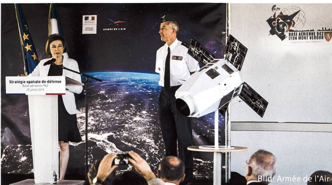
Greift nach den Sternen: Verteidigungsministerin Parly.