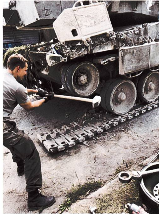
Improvisierte Feldreparatur als letzter Ausweg?

Es gehört zur Tradition. Am 26. Oktober, dem österreichischen Nationalfeiertag, fährt das Bundesheer auf. Besonders in Wien, Heldenplatz. Heuer indes droht Übergangsminister für Verteidigung und ehemaliger Berufsoffizier, Thomas Starlinger, die so genannte «Bundesheer-Leistungsschau» abzusagen. Die dafür vorgesehenen «zwei Millionen Euro könne er an anderer Stelle besser einsetzen». Wo, ist ob immensem Finanzdruck nicht klar, denn 2019 muss die Truppe weitere 47 Millionen Euro einsparen, bei einem Budget von etwa 2,3 Mia. (0,6% des BIP). Starlinger sprach deshalb bei seiner Antrittsrede Klartext: «Die Vorratskammer ist leer, im Herbst zeichnet sich eine Dramatik ab». Er brauche mindestens 3 Mia. zusätzlich, sonst wird das Bundesheer im nächsten Jahr bankrottgehen. Die Personal- und Betriebskosten werden dann nämlich hö-