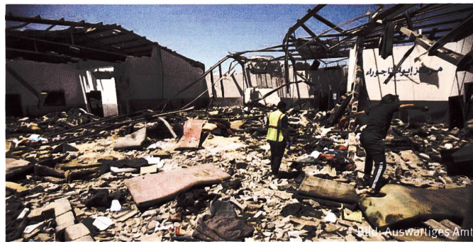
Bombardiertes Flüchtlingscamp östlich von Tripoli, Libyen.

Vom UNHCR registrierte, in Europa ankommende Migranten von Januar bis Juli 2019: 45 252. Das sind rund ein Drittel weniger als vor einem Jahr (73 852) und weniger als die Hälfte wie 2017 (119 349) im gleichen Zeitraum. 2016 waren es noch 260 000 Personen in den ersten sieben Monaten. Bemerkenswert, immer noch ist es Griechenland, das wiederum die Hauptlast trägt. Dort sind von insgesamt über 23 000 Flüchtlingen 6237 auf dem Landweg angekommen. Zur Erinnerung, im letzten Quartal 2015 kamen in Griechenland jeden dritten Tag mehr als 5000 Migranten an. Ge-