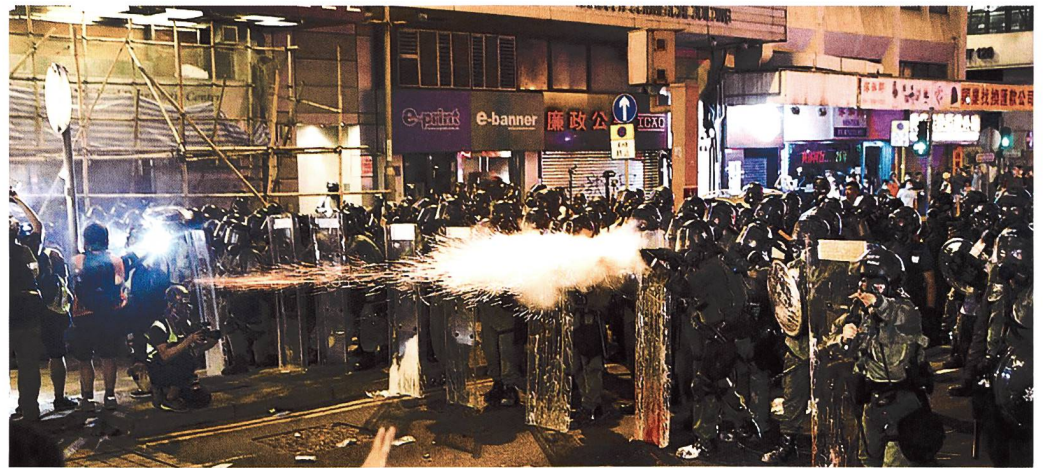
Proteste in Hongkong.

Zu Beginn ruft ein Soldat auf Kantonesisch – dem in Hongkong üblichen Dialekt – in ein Megafon, die Demonstranten seien für alle Konsequenzen selbst verantwortlich. Zum Schluss führen bewaffnete Soldaten Demonstranten mit hinter dem Rücken verbundenen Händen in Bereiche ab, die als «Arrestzonen» markiert sind.