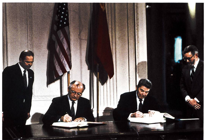
Nun definitiv Geschichte: Reagan und Gorbatschow unterzeichnen 1987 den INF-Vertrag.

tragskonform also. Beides ist unterdessen irrelevant, denn wie UNO-Generalsekretär Guterres zur verfahrenen Situation meint: «Mit dem Auslaufen des Abkommens verliert die Welt einen unschätzbaren Mechanismus, um einen Atomkrieg zu vermeiden». In der letzten Juliwoche wollte man deshalb in Genf noch Nachfolgeverträge besprechen. Die USA sogar mit dem Ansinnen, auch China einzubeziehen. Die Russen zeigten sich davon aber nicht begeistert. Nun, im Grunde ist die derzeitige Situation nichts Neues. Russland (wie auch die NATO) verfügt seit jeher über die Fähigkeit, auch in den «verbotenen» Distanzen zwischen 500–5500 km wirken zu können. Denn der INF-Vertrag bezog sich nur auf landgestützte Systeme. Insofern stellt sich für die NATO die Frage, was nun zu tun sei. Über Jahre lag der Fokus auf der Abwehr ballistischer Langstreckenraketen, die teils im Weltall abzufangen wären. Mittelstreckenraketen passen da heute nicht ganz ins Konzept, respektive fehlt in Europa die nötige Luftabwehr dagegen. Deshalb warnt Russland den Westen auch seit längerem davor, seine Ostgrenzen mit geeigneten Offensivraketen nach- und aufzurüsten. «Wenn das geschieht, lie-