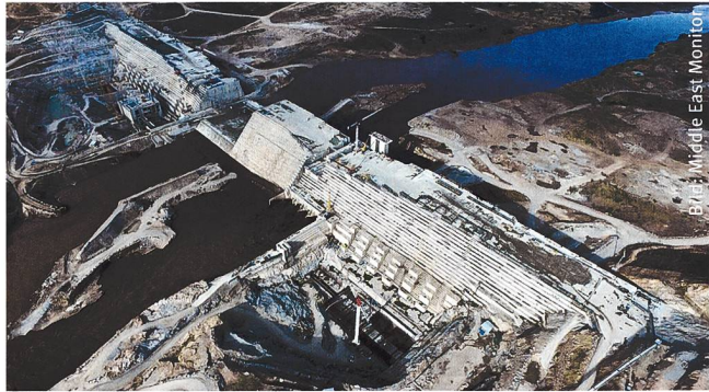
Am Fuss des Dammes die beiden Maschinenhäuser im Bau.

dert fließen zu lassen. Seit 2016 verhandeln die beiden Anrainer nun direkt miteinander – mit mässigem Erfolg. Auch der Sudan würde unter der Verknappung leiden. Doch günstige Stromlieferungen und der Schutz vor den alljährlichen Überschwemmungen haben Khartoum milde gestimmt. Besonders die Regulierung der Fliessmengen würde dem Sudan jährlich drei Erntezyklen erlauben. In dem bitter armen Land könnten dann die vorhandenen fruchtbaren Böden genutzt und der