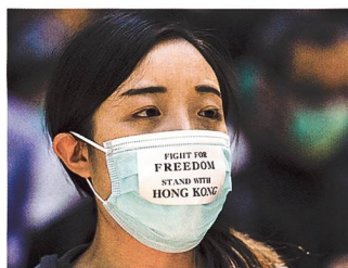
Das soll als Vermummung zählen.

Die Entscheidung rief auf der Gegenseite erneute Proteste hervor, die auch in massiver Gewalt umschlugen. Unter anderem setzten die Demonstranten nach Informationen der «South China Morning Post» einen U-Bahn-Eingang,