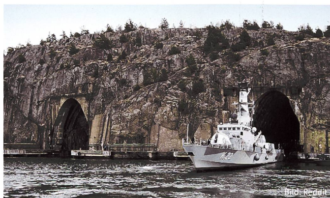
Korvette der Göteborg-Klasse beim Auslaufen auf Muskö.