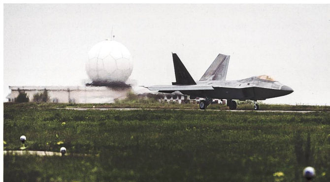
Mihail Kogalniceanu Air Base.

diger Infrastruktur auch Schulen, Kindergärten, Militärhotels und Supermärkte geben, die Gebäudefläche wird auf mehr als 30 Hektaren veranschlagt. Strom wird durch Photovoltaik und einem eigenen Kraftwerk generiert, das gesamte Areal von 76 km Stacheldraht umzäunt. Derzeit ist Mihail Kogalniceanu besonders für die US-Streitkräfte relevant, diese nutzen den Standort als Transitpunkt für ihre Truppen und Waffen, welche in den nahen und ferneren Osten verschoben werden, aber auch als Hub für das in Rumänien stationierte THAAD antiballistische Raketenabwehrsystem. Vor allem