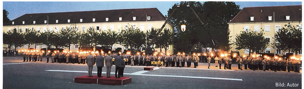
Grosser Zapfenstreich in der Robert-Schumann Kaserne Müllheim.

Für seine Einsätze ist die Brigade in die Befehlsstrukturen des Eurokorps eingebunden. Seit 2018 ist eines der Haupteinsatzgebiete das afrikanische Mali. 2018 waren Teile der Brigade in Litauen im Einsatz. Engagements in Afghanistan sowie auf dem Balkan gingen voran. Die Brigade war bisher auch immer wieder in der Katastrophenhilfe engagiert, so bspw. im Jahr 2000 bei der Havarie des Tankers Erika vor der bretonischen Küste, oder beim Elbe-Hochwasser von 2002.