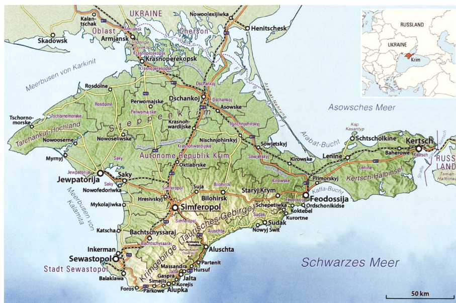
Halbinsel Krim.