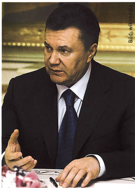
Wiktor Janukowitsch, Präsident der Ukraine Februar 2010 bis Februar 2014.

In der Tat hatte man in Moskau nach dem Sturz von Janukowitsch und dessen Flucht nach Russland am 22. Februar 2014 die drohenden strategischen Konsequenzen des Verlustes der Marinebasis Sewastopol sofort erkannt und wie Putin am 9. März 2015 in einer Dokumentation des russischen Fernsehsenders Rossija 1 offenlegte, am 23. Februar 2014 die entsprechenden Massnahmen eingeleitet. Und es war vor dem Hintergrund des Konflikts mit den USA und der Europäischen Union durchaus konsequent, dass der russische Staatspräsident am 9. Mai 2014 die alljährliche Militärparade anlässlich des Sieges im Grossen Vaterländischen Krieg nicht nur in Moskau abnahm, sondern auch in Sewastopol besuchte und